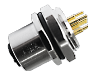
母头成型式双线缆，直头，不锈钢螺母 M12 母头面板式，PCB型，前锁安装 M12 母头面板式，PCB型，后锁安装