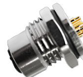
M12 母头面板式，PCB型，前锁安装，屏蔽针 M12 母头面板式，PCB型，后锁安装，屏蔽针 M12 母头面板式，焊接式，前锁安装