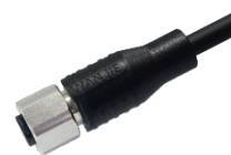
母头成型式线缆，直头，非屏蔽，不锈钢螺母 母头成型式线缆，弯头，非屏蔽，不锈钢螺母 母头成型式线缆，直头，屏蔽，不锈钢螺母