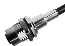
M12 母头面板式，焊接式，后锁安装，焊电子线 M12 母头面板式，焊接式，方形法兰型，焊电子线 M12 母头面板式，焊接式，前锁安装，屏蔽线缆